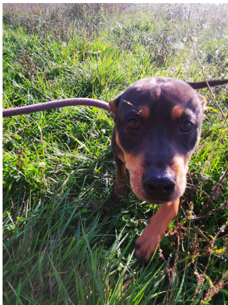
Rüde FREDDY, geboren 2024, Größe 40cm, Gewicht 7kg

FREDDY ist ein junger Hund - verspielt und munter. Er braucht weitere Ausbildung und steht bei uns im täglichen Training.