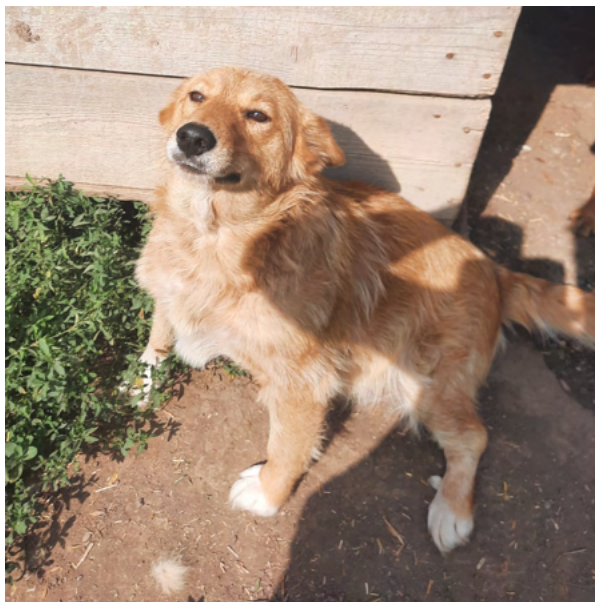
Hündin MOLI, geboren 2018, Größe 45cm, Gewicht 18kg

MOLI ist sehr verträglich und freundlich mit allen Hunden und Menschen.