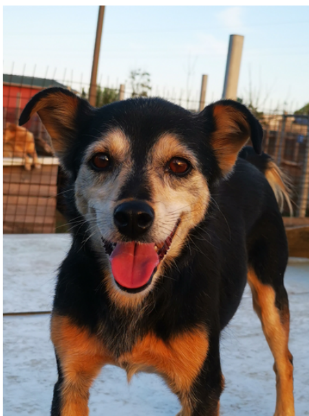
Hündin, geboren 2017, Vergabe ab 2025