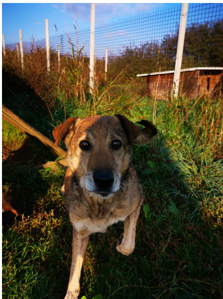
Rüde, geboren 2018, Vergabe ab 2025