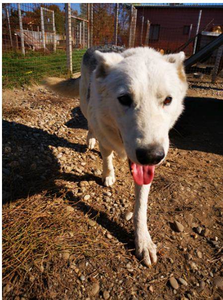
Rüde, geboren 2027, Vergabe ab 2025