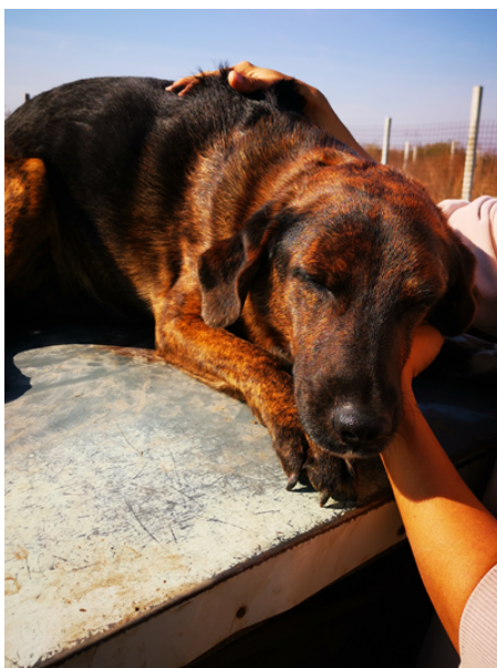
Rüde, geboren 2019, Vergabe ab 2025